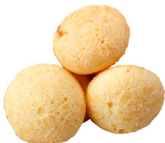
Mini Pão de Queijo