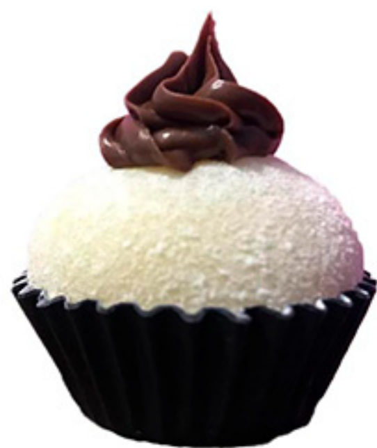
Ninho com Nutela