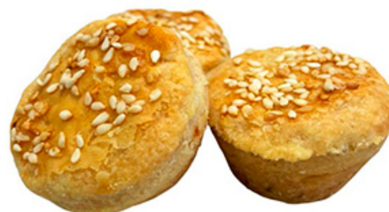
Empada M. de Nata