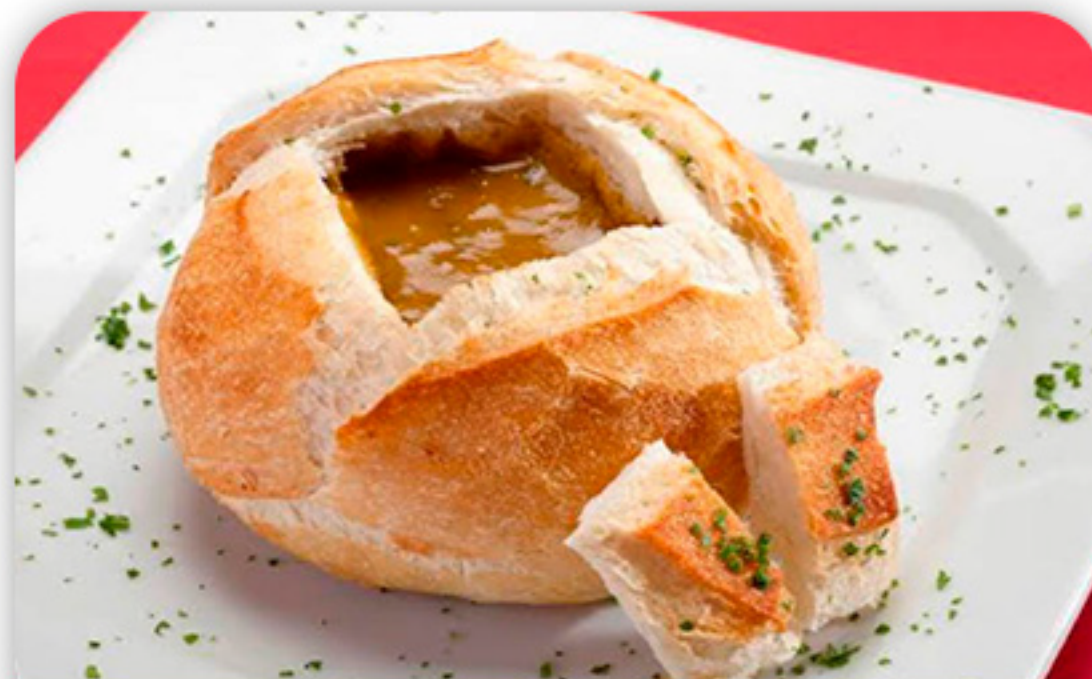
Mini Pão de Sopa