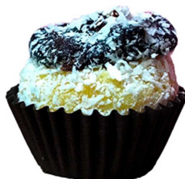
Olho de Sogra